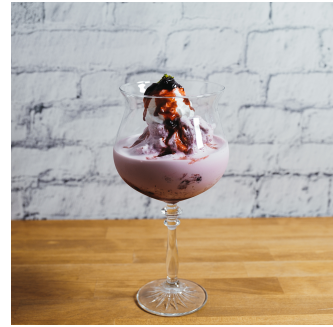
ハスカップのシェイク