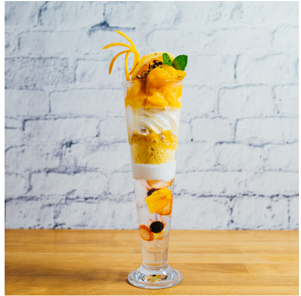
金柑とオレンジのパフェ 2100+tax 2310 in tax

北海道の農家さんから仕入れた、 本土に滅多に出回ることのないハスカップの原種を 贅沢に使用したコンフィチュールのパフェです。