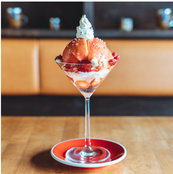
国産りんごとフランボワーズの アフタヌーンパフェ 1300+tax 1430 in tax