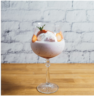
いちごと木苺のシェイク