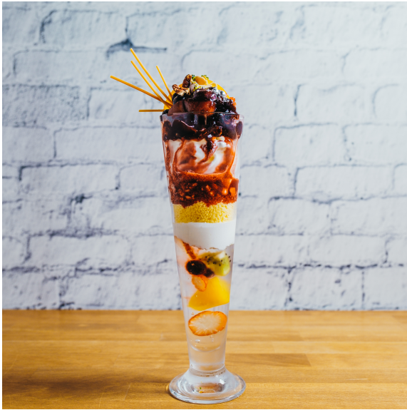
ハスカップとフランボワーズのパフェ 2150+tax 2365 in tax