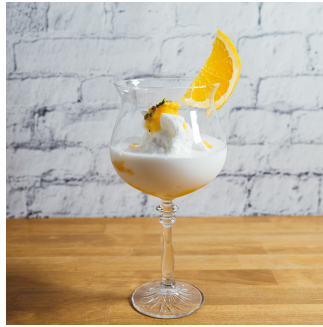
クレモンティーヌのシェイク